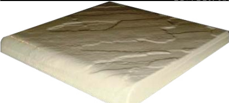
Размер 345x345x35 мм Бордюр «Полукруглый»