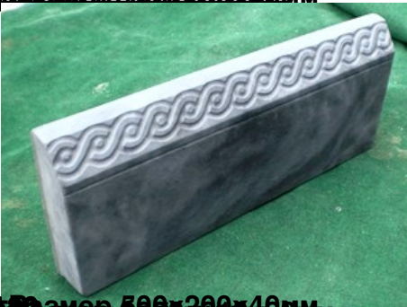
Размер 500x200x40 мм Бордюр «Греческий»