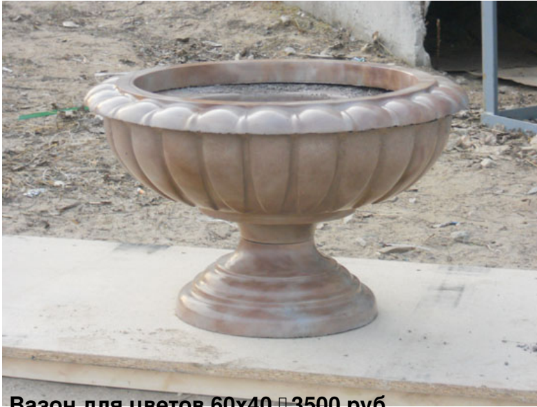
Вазон для цветов 60х40 — 3500 руб.