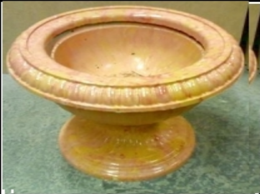
Вазон . Цена - 2100 руб. 45 40