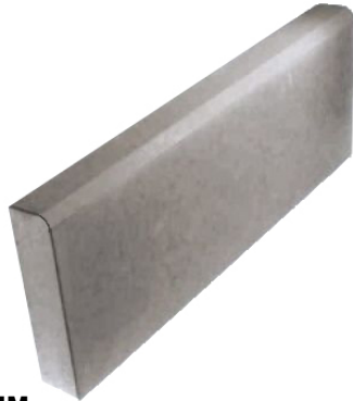
Размер 500x200x40 мм